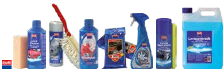
SELECCIÓN CUIDADO AUTOMÓVIL