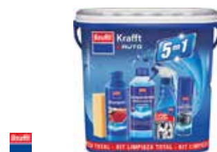
KIT AUTO LIMPIEZA 5 EN 1 5 artículos