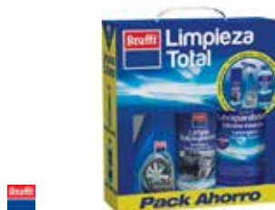
KIT AUTO LIMPIEZA TOTAL 3 artículos