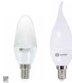
LÁMPARA VELA LED