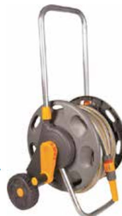
CARRO MANGUERA 2487R9012 30M