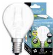
LÁMPARA ECO HALÓGENA MATE