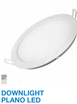
DOWNLIGHT PLANO LED