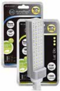
LÁMPARA PL LED