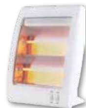
ESTUFA CUARZO 2 TUBOS 400/800W