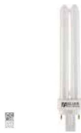
LÁMPARA PLC4 PINS