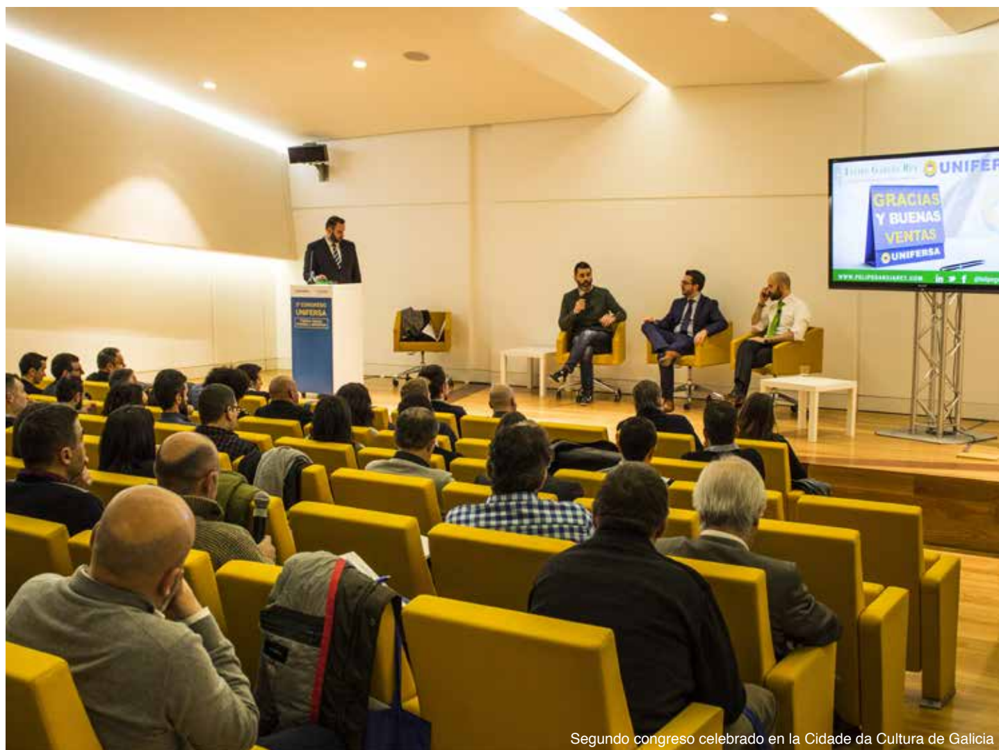
Segundo congreso celebrado en la Cidade da Cultura de Galicia

Desde el año 2017, Unifersa reúne anualmente en la ciudad de Santiago a sus socios y asociados en un congreso cuyo principal objetivo es la formación y la reflexión sobre temas de interés y actualidad en el sector.