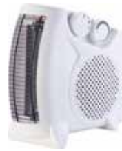
CALEFACTOR VERTICAL/HORIZONTAL 1000/2000W