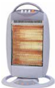
ESTUFA HALÓGENA GIRATORIA 400/800/1200W