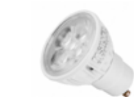
LÁMPARA DICROICA LED