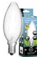
LÁMPARA ECO HALÓGENA VELA