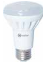
LÁMPARA REFLECTORA LED