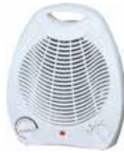
CALEFACTOR VERTICAL 1000/2000W