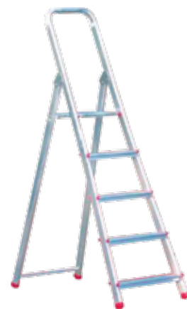
ESCALERA DOMÉSTICA 5 PELDAÑOS