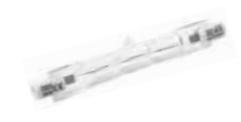
LÁMPARA ECO HALÓGENA LINEAL