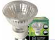
LÁMPARA DICROICA HALÓGENA