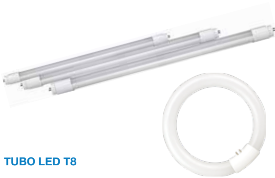
TUBO LED T8