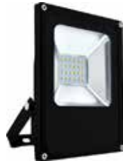
PROYECTOR LED 20W 6000K LUZ FRIA