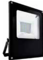
PROYECTOR LED 30W 6000K LUZ FRIA