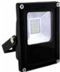
PROYECTOR LED 10W 6000K LUZ FRIA