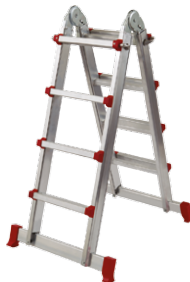
ESCALERA TELESCOPICA ALUMINIO 4X4