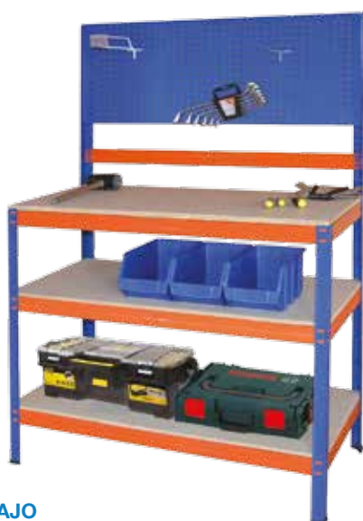
BANCO TRABAJO 1,5X1,0X0,5M