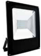
PROYECTOR LED 50W 6000K LUZ FRIA