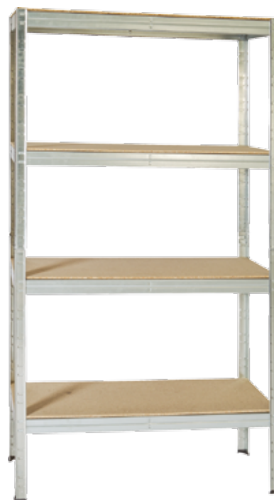
KIT ESTANTERIA GALVA 4 BALDAS 177X90X40CM