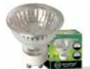
LÁMPARA HALÓGENA DICROICA GU10/50W GU10 50W