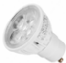
LÁMPARA DICROICA LED 5W GU10 Disponible 5000K BLANCO, 5000K GRIS, 3000K BLANCO