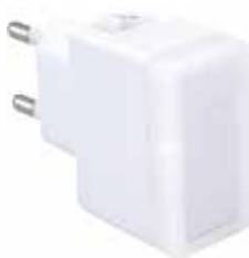
LUZ NOCHE LED 0,4W