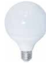
GLOBO LED E27/14W Disponible 3000K LUZ CALIDA, 6000K LUZ FRIA