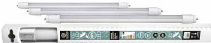
TUBO LED T8 Disponible varias dimensiones, intensidades y tipos de luz.