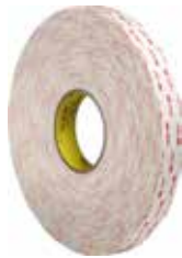
3M CINTA DOBLE CARA VHB 4941PBL 3,0MX19MM