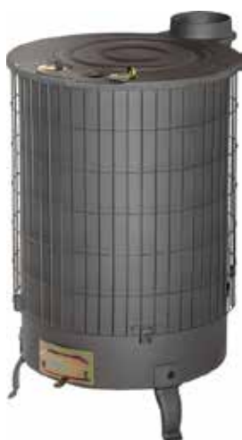
ESTUFA MIXTA N2 Disponible 14,0KW, 14,5KW Y 15,0KW