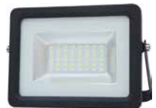
PROYECTOR LED 20W 6000K LUZ FRIA