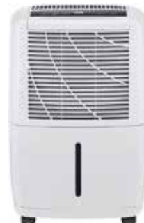
DESUMIDIFICADOR DN-20-E 2,8L