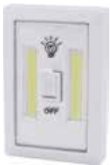
LUZ ARMARIO LED COB 1W