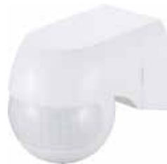
DETECTOR MOVIMIENTO LED PARED 230V