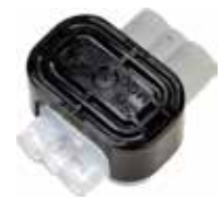
3M CONECTOR SCOTCHLOK MGC