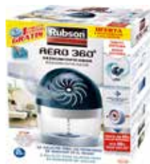
DESUMIDIFICADOR AERO 360°