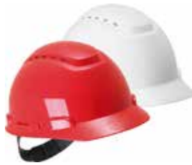
3M CASCO H700 CON VENTILACION BLANCO O ROJO