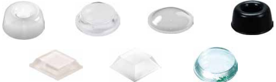
3M TOPES PROTECTORES AUTOADHESIVOS VARIOS MODELOS