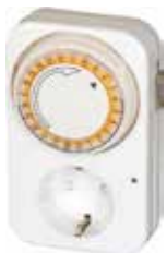
TEMPORIZADOR DIARIO 24H