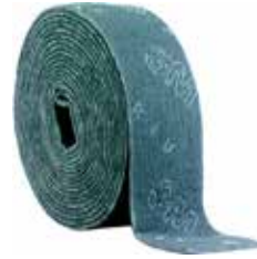
3M ROLLO PRECORTADO SCOTCH-BRITE 966134 6MX134MM VERDE