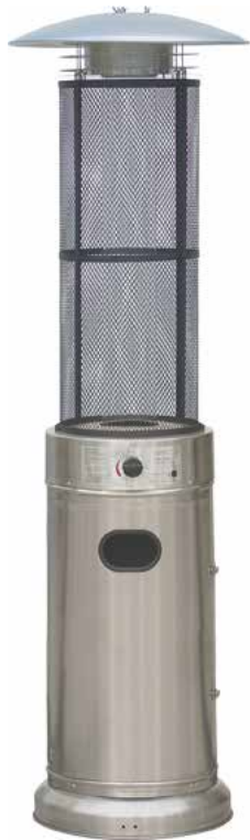
BUTSIR ESTUFA EXTERIOR COLUMNA INOX 13KW