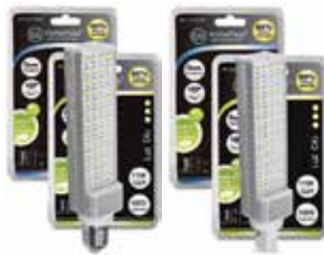
LÁMPARA PL LED 6400K Disponible E27, G24