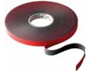
3M CINTA DOBLE CARA VHB 4611FBL 3,0MX19MM