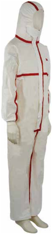
3M BUZO DESECHABLE P4565 BLANCO/ROJO. L, XL, XXL.