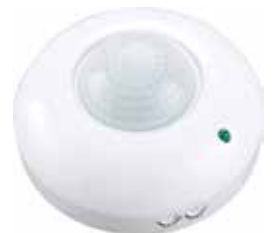
DETECTOR MOVIMIENTO LED TECHO 230V