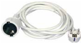
PROLONGADOR BLANCO 2M,3M,4M