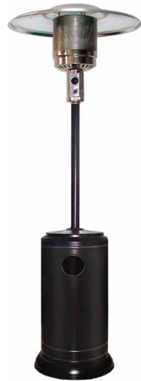
BUTSIR ESTUFA EXTERIOR HSS NEGRO 13KW