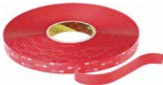
3M CINTA DOBLE CARA VHB 4910FBL 3,0MX19MM