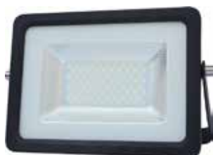
PROYECTOR LED 30W 8000458 6000K LUZ FRIA