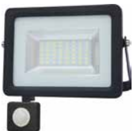
PROYECTOR LED 20W SENSOR 6000K LUZ FRIA