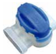
3M CONECTOR SCOTCHLO 314 6UD BLISTER