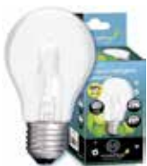
LÁMPARA ECO HALÓGENA ESTANDAR MATE E27 Disponible 42W(60W) 630LM, 70W(100W) 1200LM