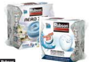
RECAMBIOS TABLETAS DES- HUMIDIFICADORES