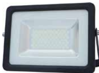
PROYECTOR LED 50W 8000459 6000K LUZ FRIA