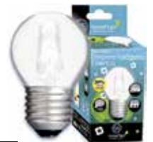
LÁMPARA ECO HALÓGENA ESFÉRICA MATE E27 Disponible 28W(40W) 350LM, 42W(60W) 630LM