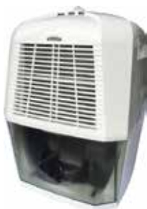
DESUMIDIFICADOR DF-12-A 2,5L