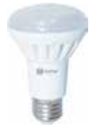
LÁMPARA REFLECTORA R63 LED E27 Disponible 6000 LUZ FRIA, 3000K LUZ CALIDA