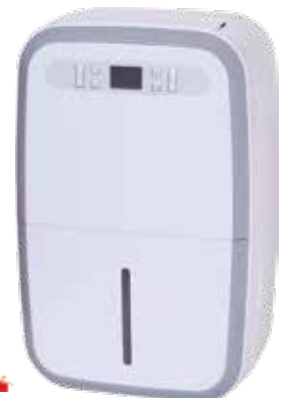
DESUMIDIFICADOR CON CALEFACCION DN 35-RE 4,8L