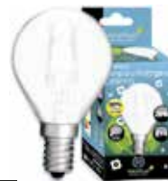
LÁMPARA ECO HALÓGENA ESFÉRICA MATE E14 Disponible 42W(60W) 630LM