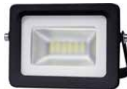
PROYECTOR LED 10W 6000K LUZ FRIA