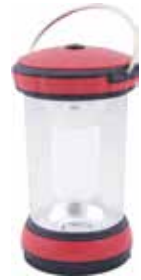
LINTERNA CAMPING LED 8000613 1W