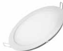
DOWNLIGHT PLANO LED 18W Disponible 4000K, 3000K