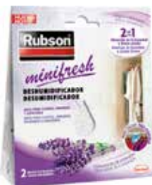
ABSORBENTE HUMEDAD MINIFRESH LAVANDA