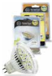
LÁMPARA DICROICA LED MR16/4,6W 3000K LUZ CALIDA