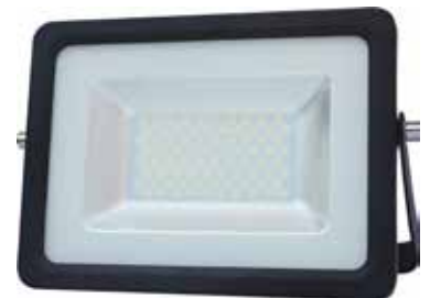
PROYECTOR LED 100W 8000459 6000K LUZ FRIA