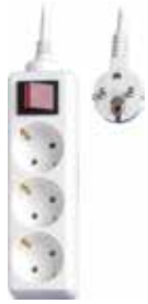
BASE MÚLTIPLE 2P+TT CON INTERRUPTOR 3 bases,4 bases