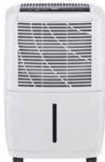
DESUMIDIFICADOR DN-16-E 2,8L