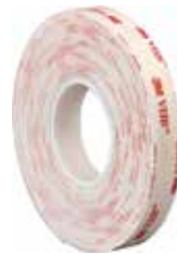
3M CINTA DOBLE CARA VHB 4952PBL 3,0MX19MM