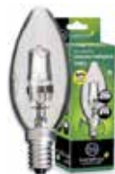
LÁMPARA ECO HALÓGENA VELA CLARA E14 Disponible 42W(60W) 630LM, 28W(40W) 350LM